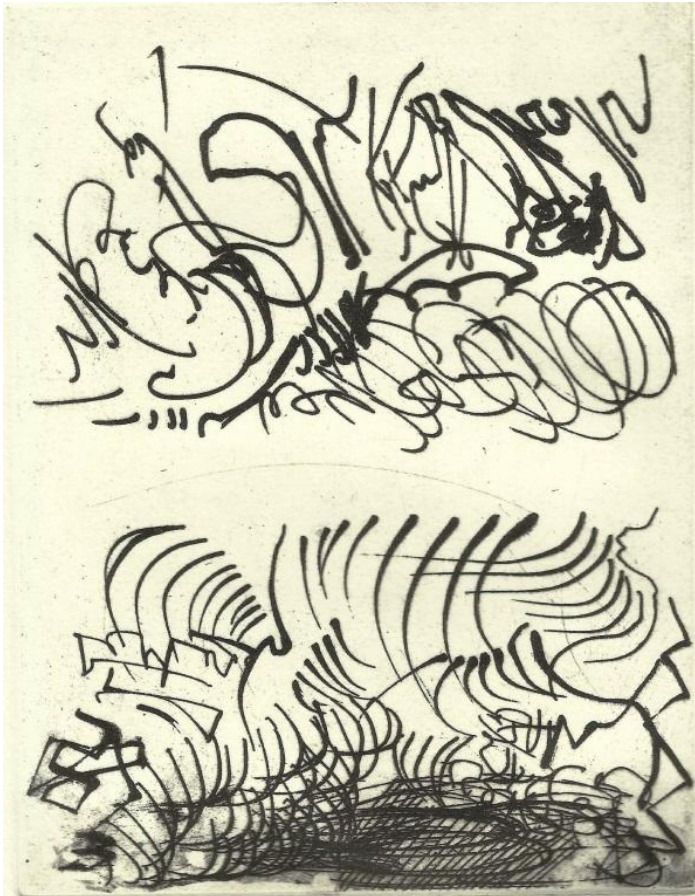
Imagen de un grabado estampado en el que en la parte superior se muestran trazos realizados con pluma de caña de bambú. En la parte inferior de la imagen: trazos grabados realizados con pluma metálica. En esta prueba se puede apreciar la fidelidad de la técnica en relación a la imagen creada en origen y el modo tan fiel de transmitir el “carácter” único de los trazos con pluma.

Imagen de los dos tipos de pluma más usados en esta técnica: la pluma de caña de bambú y la metálica.