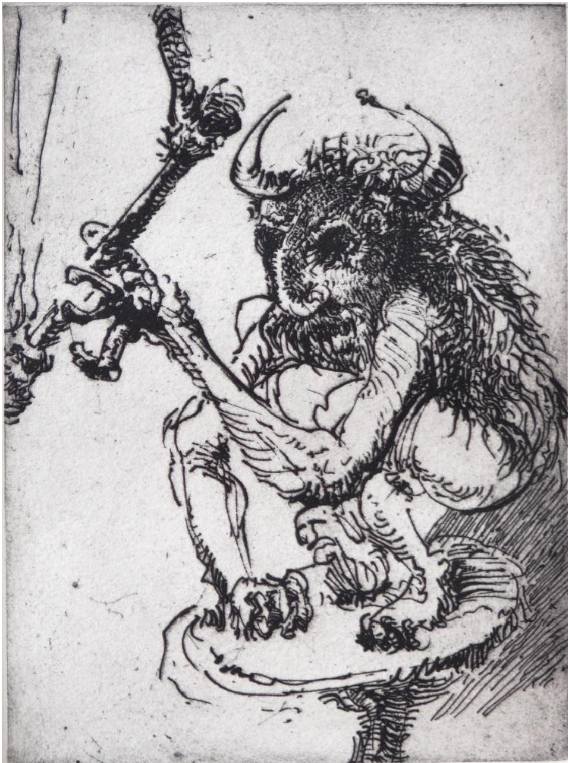
Antropoides 20 x 15 cm- Grabado a la pluma.